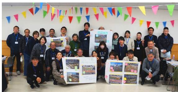
皆さんの「こうなったらいいな」と一緒に記念撮影