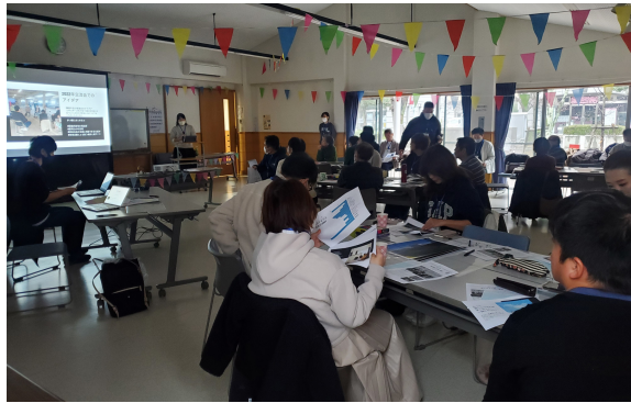
冒頭、会の説明をしている様子