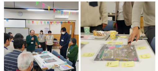
お互いのアイデアを知り合う